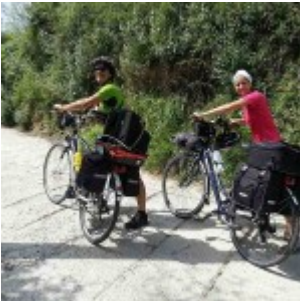
Ciao ciao Magliano Sabina!