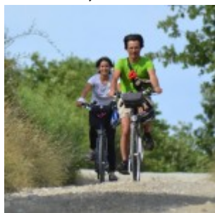
Potete dedurre la pendenza dalla pettinatura!