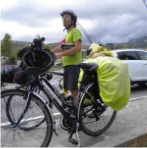
Eboli, appena arrivati!