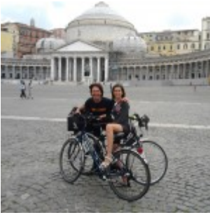
Benvenuti a Napoli!