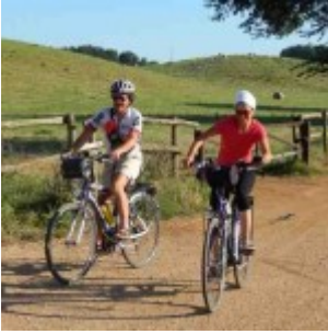
Sulla doganale per il lago