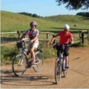
Sulla doganale per il lago