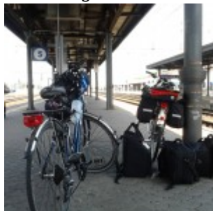
In attesa di un treno