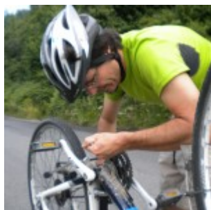
e si smagliò la catena!