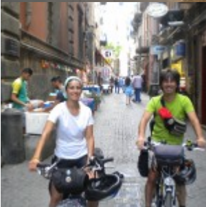
Au revoir, Spaccanapoli!