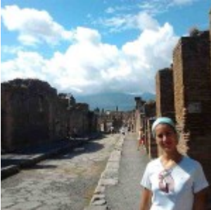
Via Maestra a Pompei