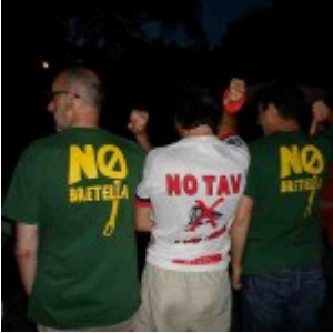
Se non avevate capito...pè ì ndò??