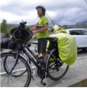
Eboli, appena arrivati!