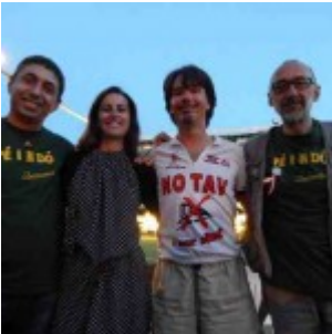
No Tav...pè ì ndò??